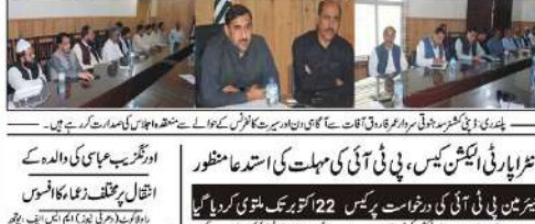
برقیات و ڈیڈ لائن کے بارے میں مسئلہ، برقیات و ڈیڈ لائن کے بارے میں مسئلہ۔