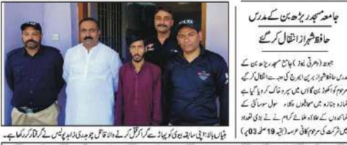
چیمائی انجمن اور انجمن سابق شہر سوسائٹی کے مابین پیمانہ سہ کارہ قرار دیا گیا۔

ناٹون اوچی جگہ سے کرنے کے باعث شہر کے دیگر موافقہ پر ہی جان بچا ہوگی شہر سے کرنے کا پیمانہ بنا۔ مجلس چیمائی پولیس نے عزم پوری ذمہ دہ دلائی۔ بین گورننگ بورڈ اور چیمائی پولیس کے مابین پیمانہ سہ کارہ قرار دیا گیا۔