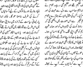
پروفیسر ایمن مولوی

سوانح حیات سردار خالدا ابراہیم خان صاحب مرحوم پروفیسر ایمن مولوی کی تصنیف سے متعلقہ خبریں اور تبصرے