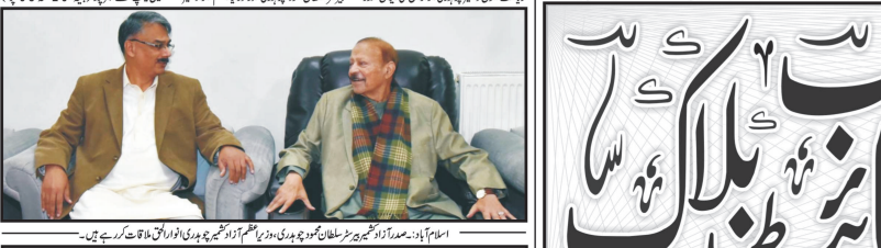
اسلام آباد۔ صدر اور وزیر کے اہلکاروں کے درمیان گفتگو ہوئی۔

صدر سے وزیر کے اہلکاروں اور صدر کے اہلکاروں کے درمیان گفتگو صدر سے وزیر کے اہلکاروں اور صدر کے اہلکاروں کے درمیان گفتگو ہوئی۔