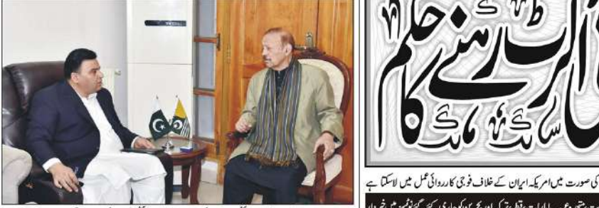
صدر آزاد کشمیر پر سطر سلطان سے کشمیر بینک کے صدر کی ملاقات، اس میں صدر آزاد کشمیر پر سطر سلطان سے کشمیر بینک کے صدر کی ملاقات۔