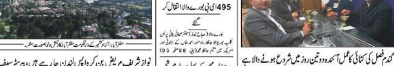
3 روز عرس 11 اپریل کو گورنر مظفر آباد میں شروع ہوگا۔

3 روز عرس 11 اپریل کو گورنر مظفر آباد میں شروع ہوگا۔ 3 روز عرس 11 اپریل کو گورنر مظفر آباد میں شروع ہوگا۔